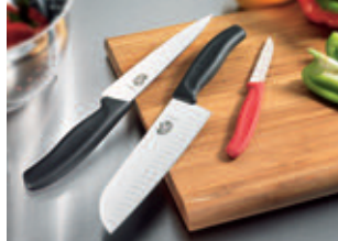
Kitchen & Professional knives