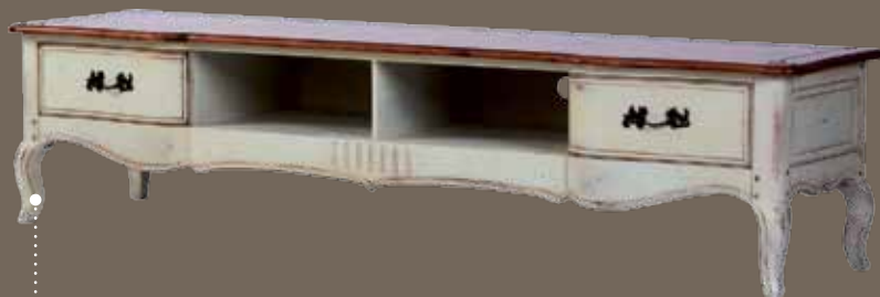
DF833 S11 ТВ-тумба 210 X 54 X 49