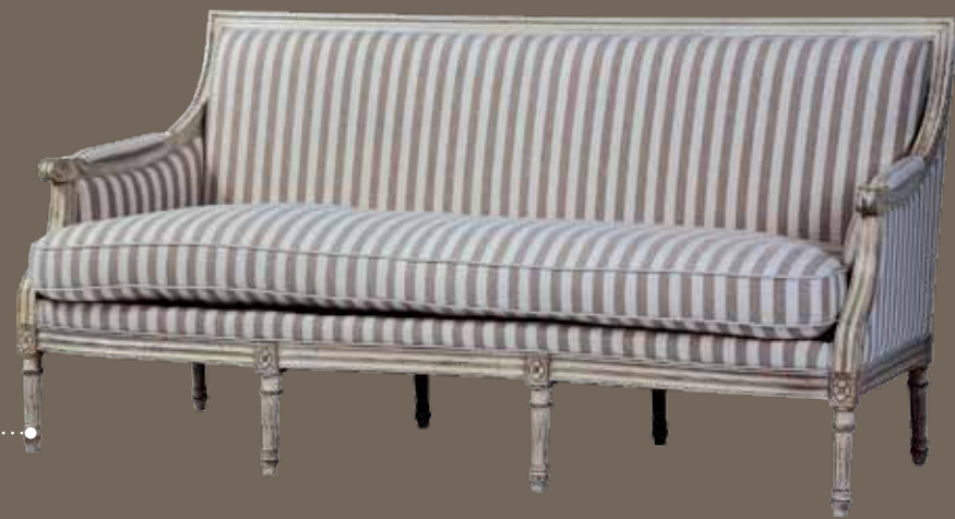
DF814-3 Диван 189 X 82 X 92