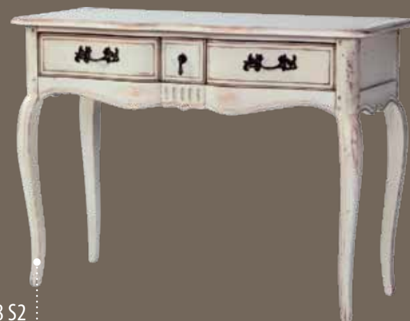
DF808 S2 Консоль 110 X 47 X 80