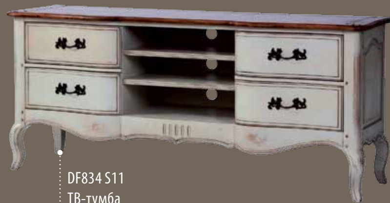
DF834 S11 ТВ-тумба 158 X 48 X 69