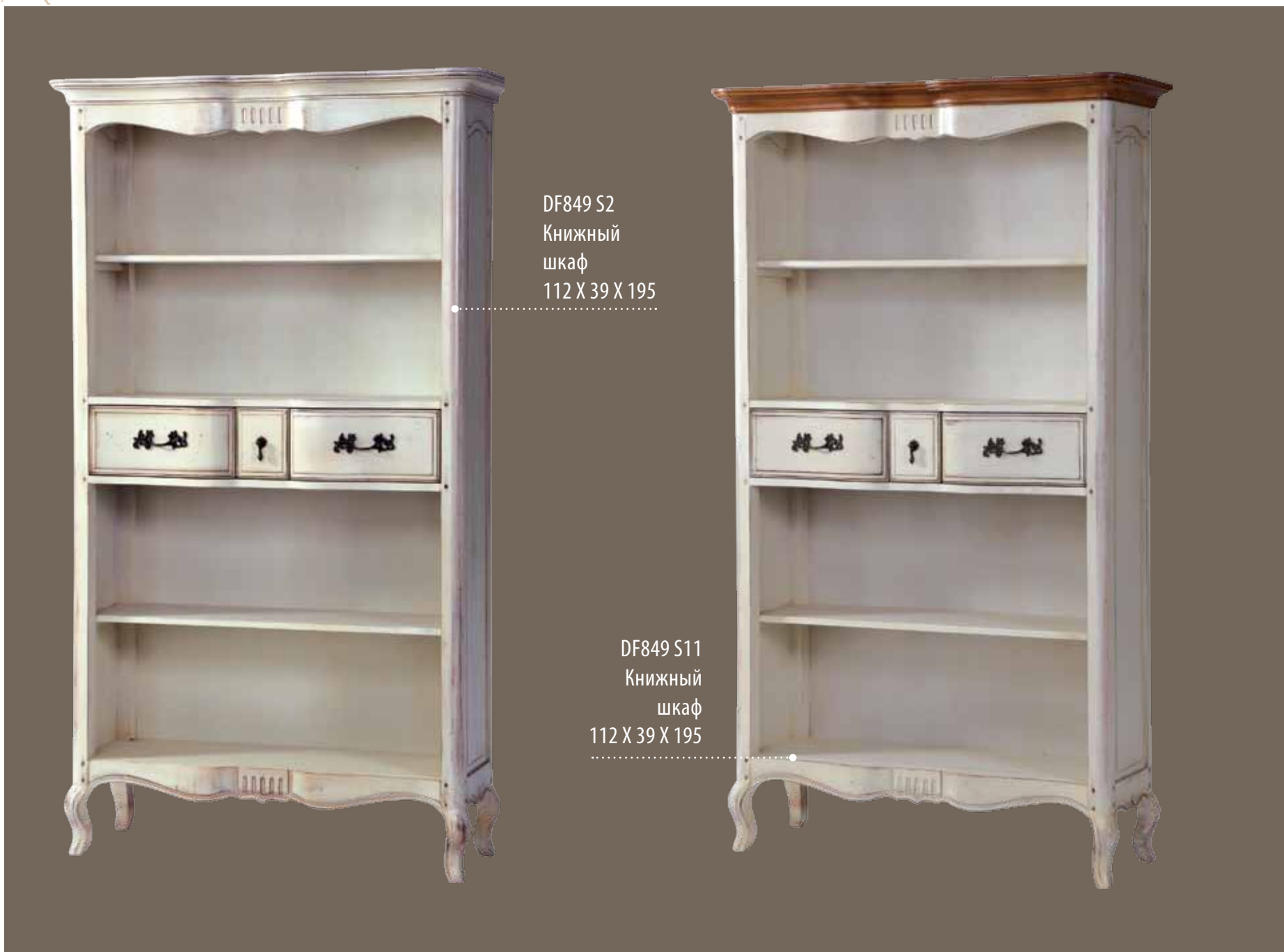
DF849 S2 Книжный шкаф 112 X 39 X 195