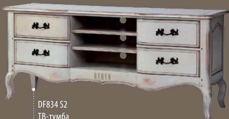
DF834 S2 ТВ-тумба 158 X 48 X 69