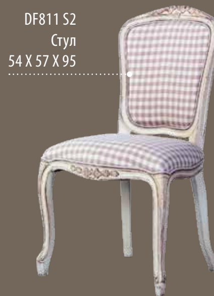
DF811 S2 Стул 54 X 57 X 95