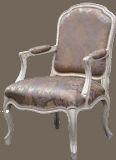
DF812 Кресло 63 X 68,5 X 94