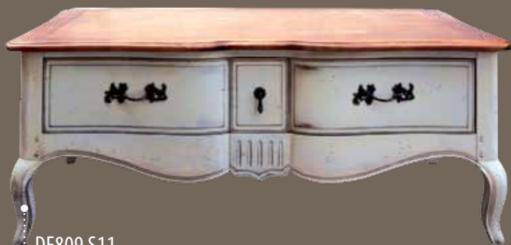
DF809 S11 Кофейный столик 122 X 80 X 49