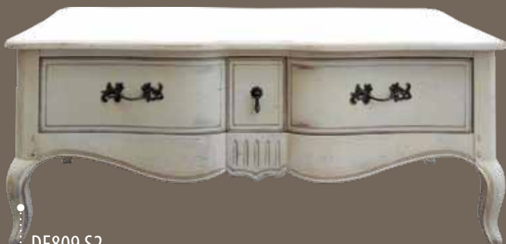
DF809 S2 Кофейный столик 122 X 80 X 49