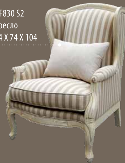
DF830 S2 Кресло 84 X 74 X 104