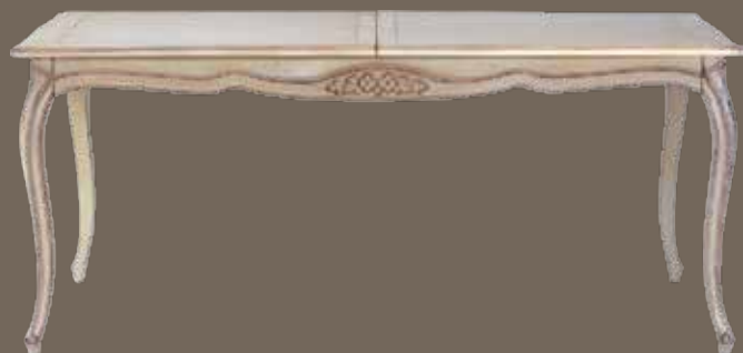
DF889 S2 Стол обеденный раздвижной (180-230) X 103 X 77.5