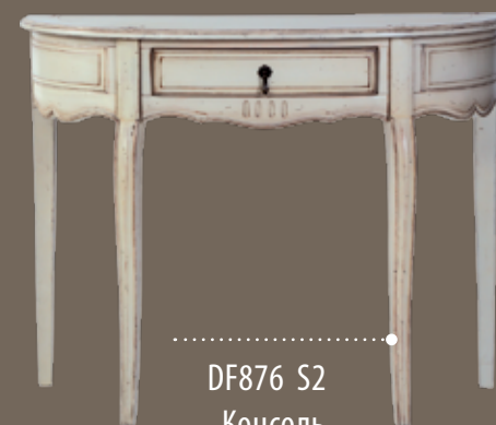
DF876 S2 Консоль 108 X 42 X 85