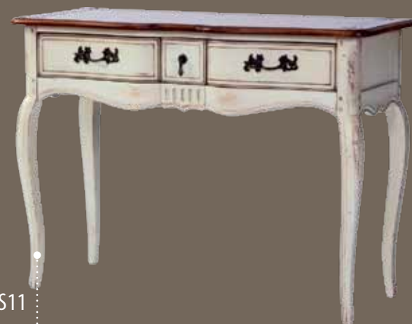
DF808 S11 Консоль 110 X 47 X 80