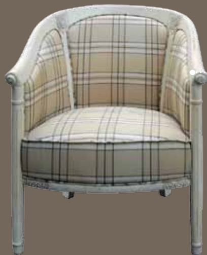
DF848 S2 Кресло 71 X 68 X 79.5