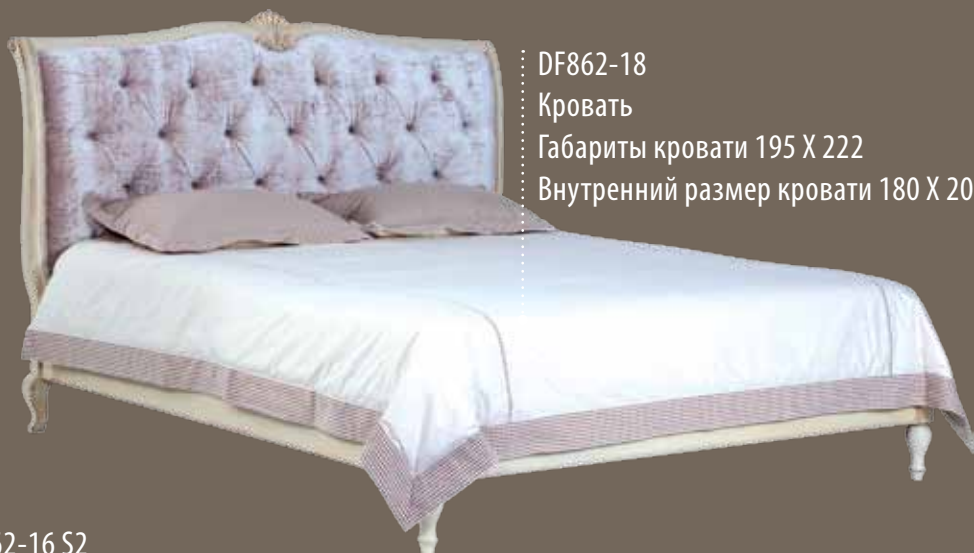
DF862-18 Кровать Габариты кровати 195 X 222 Внутренний размер кровати 180 X 200