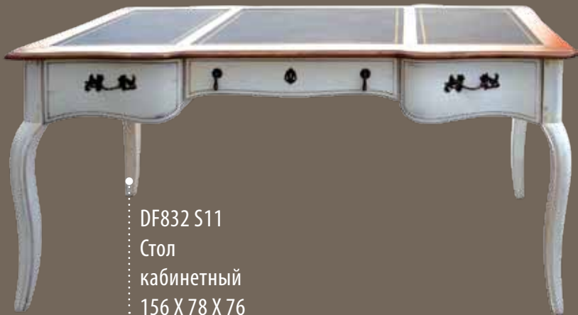
DF832 S11 Стол кабинетный 156 X 78 X 76