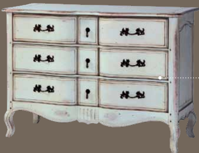
DF815 S2 Комод 120 X 52 X 85