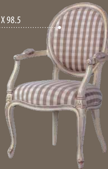
DF824 S2 Кресло 59 X 65 X 98.5