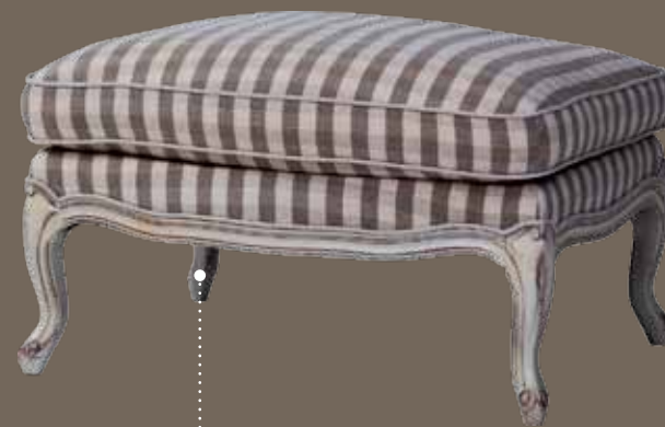
DF836 S2 Пуфик 74 X 57 X 43