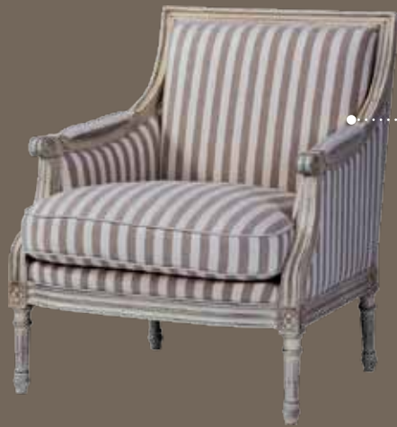
DF814 S2 Кресло 81 X 79 X 93