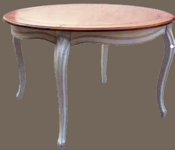
DF877 S11 Стол обеденный DIA. 120 X 77