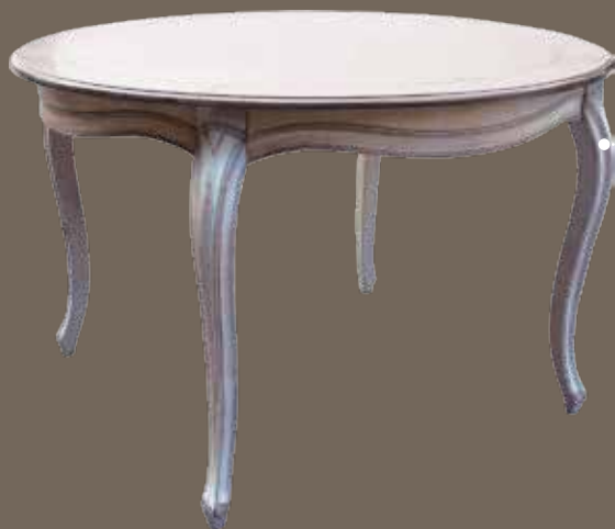
DF877 S2 Стол обеденный DIA. 120 X 77