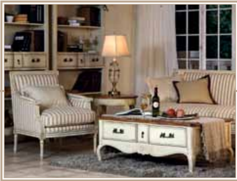
Гостиные 10 - 21см.