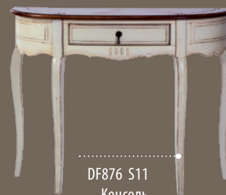
DF876 S11 Консоль 108 X 42 X 86