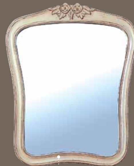
DF817 S2 Зеркало 70 X 3 X 86