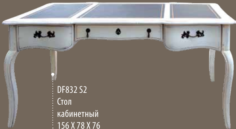
DF832 S2 Стол кабинетный 156 X 78 X 76