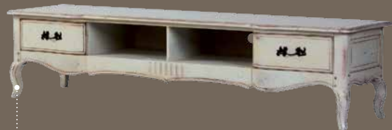
DF833 S2 ТВ-тумба 210 X 54 X 49