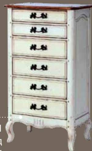
DF821 S11 Комод 66 X 44.5 X 116