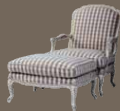
DF813 S2 Кресло 75 X 78 X 96