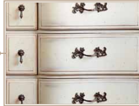
Описания 34 - 48см.