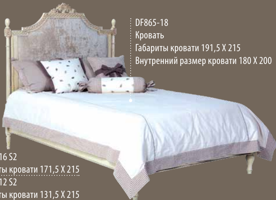
DF865-18 Кровать Габариты кровати 191,5 X 215 Внутренний размер кровати 180 X 200