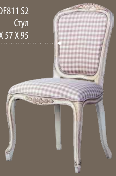
DF811 S2 Стул 54 X 57 X 95