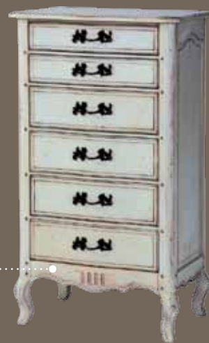
DF821 S2 Комод 66 X 44.5 X 116