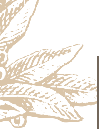
DF855 S11 Кофейный столик DIA. 60 X 60