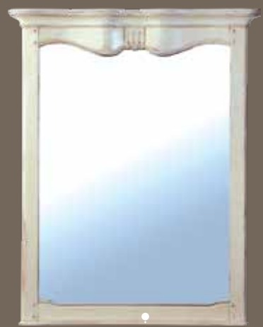
DF816 S2 Зеркало 89.6 X 9.5 X 111.5