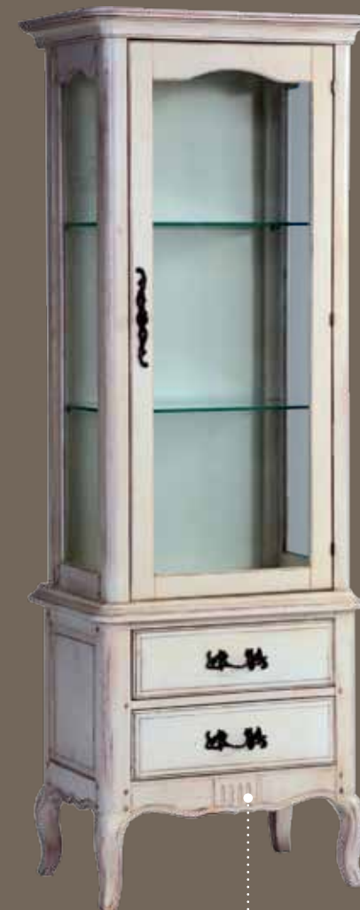
DF860R-3S2 Сервант 70.5 X 46.3 X 180