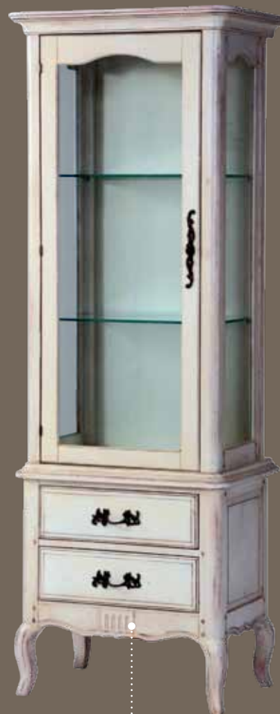
DF860L-3S2 Сервант 70.5 X 46.3 X 180