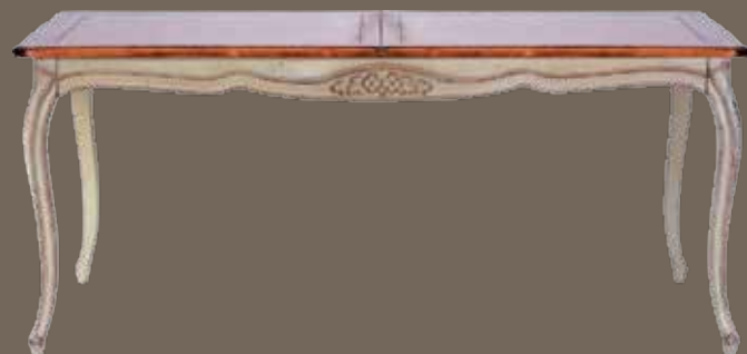
DF889 S11 Стол обеденный раздвижной (180-230) X 103 X 77.5