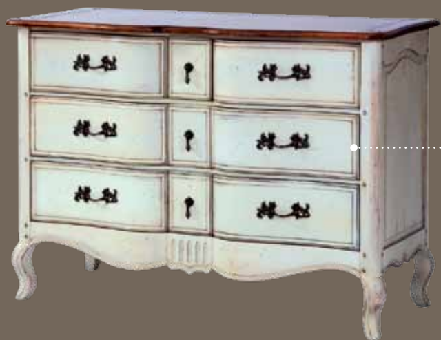
DF815 S11 Комод 120 X 52 X 85