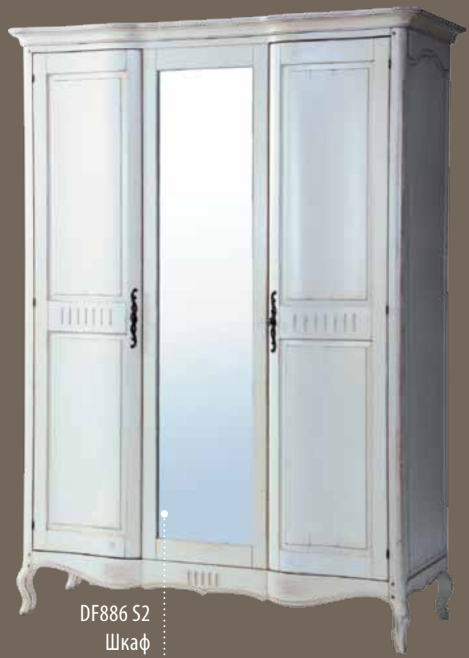
DF886 S2 Шкаф 161 X 62.5 X 220