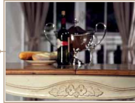
Столовые 28 - 33см.