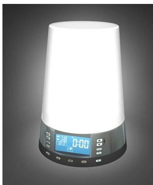
Рис.1. Общий вид светильника

MT5090 - оригинальный и полезный подарок. По-настоящему ценным для человека становится то, что он с удовольствием использует каждый день. Хорошо выспаться и легко встать! Вы же знаете - от хорошего сложно отказаться. Ещё лучше, когда подарок удобный и полезный, тогда человек будет с удовольствием пользоваться им каждый день, потому что Вы дарите ему бодрость и хорошее настроение. Ваш подарок будет каждый день защищать его от стресса и усталости.